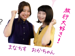
まなちす おかちゃん

みなさん、関西・大阪方面へはいつもどんな交通手段を使って行っていますか? 実は松山空港と関西空港を結ぶ飛行機「Peach」が一番お得で早いです! ここでは「Peachビギナー」の編集部が、賢い使い方を体験レポート!